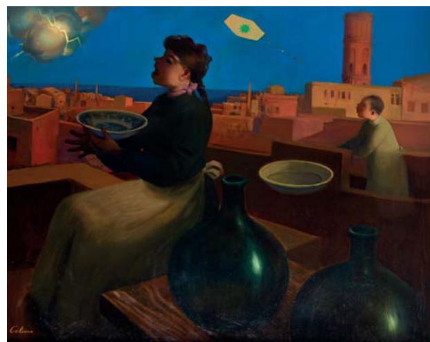
Crepuscle 1988 149 x 90 cm Oli sobre tela