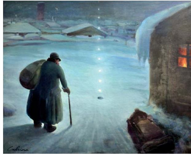
La rosa i l'interruptor 1950 70 x 50 cm Oli sobre tela