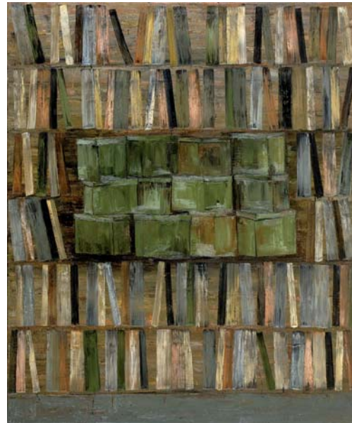
Biblioteca - 'Vanitas' 2 2006 180 x 150 cm Oli sobre tela