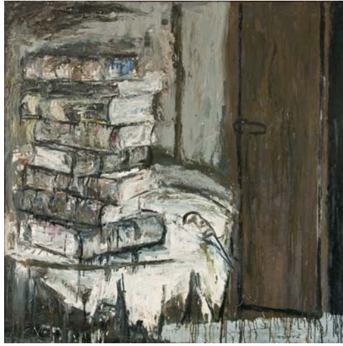
Sense títol 1985 130 x 194 cm Oli sobre tela (díptic)