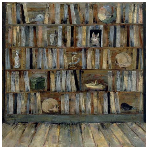
Biblioteca - 'Vanitas' 3 2006 200 x 240 cm Oli sobre tela