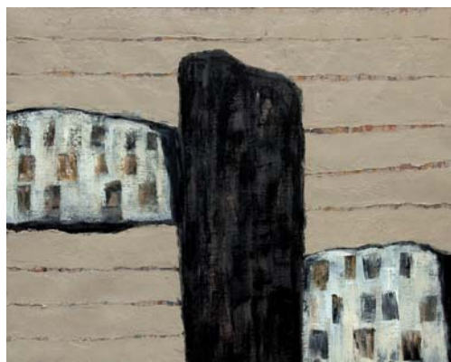
Fàbrica 2013 80 x 100 cm Oli sobre tela