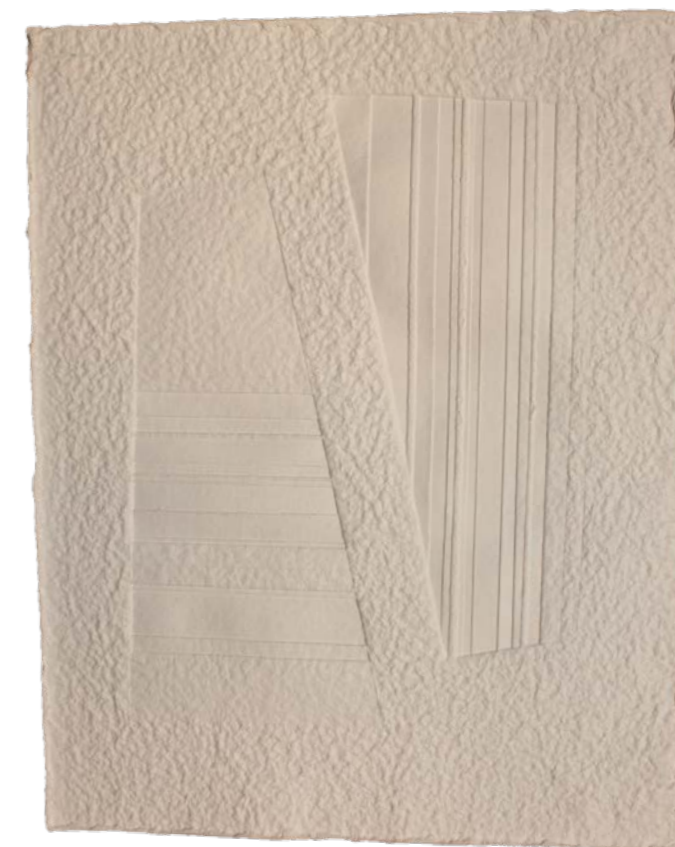
Fulls de neu Gofrats sobre paper fet a mà, impresos per l'artista. Planxes realitzades per ell mateix. 2014