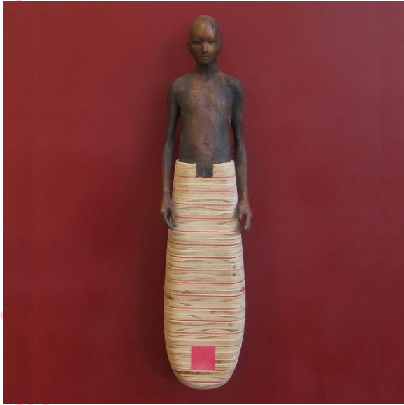
Jesús Curiá Foc, Aluminium IV (2019) Bronze i fusta Galeria Jordi Barnadas (Barcelona)