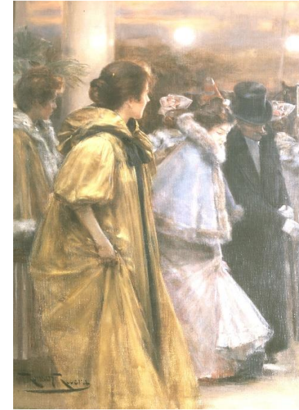
Romà Ribera Sortida del ball (1913) Oli sobre tela, 82,5 x 62,5 cm Museu de Montserrat, 200.519

Romà Ribera (Barcelona, 1849-1935) va representar en diverses de les seves obres la vida mundana de la societat burgesa de la seva època. El moment de l'entrada i sortida de balls i espectacles era per ell una excusa perfecta per pintar els detalls dels vestits i mostrar el glamur dels seus retratats. Aquest diàleg confronta dues obres de Ribera amb el mateix títol i temàtica però amb un punt de vista absolutament diferent. L'obra convidada, executada probablement a París vint-i-cinc anys abans que l'obra que pertany al museu, incorpora elements inquietants en l'escena i pràcticament no veiem la sortida dels assistents al ball, però sí els personatges que estan al carrer i que no pertanyen a aquest món luxós. La pintura va guanyar la medalla d'or de l'Exposició Universal de Barcelona del 1888.