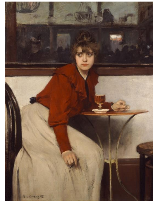
Ramon Casas Madeleine (1892) Oli sobre tela, 117 x 90 cm Museu de Montserrat, 200.397

Mònica Castanys (Barcelona, 1973) pinta una noia sola en una cafeteria. Tan sola com està la Madeleine pintada per Ramon Casas 132 anys abans. Les dues escenes evocuen històries personals que no coneixem, que només podem imaginar. Castanys, gran admiradora de l'obra de Casas i la pintura modernista, s'inspira en aquests moments reals de soledat de dones que estan a cafeteries, passegen o van en bicicleta. Les fotografia i després transforma l'escena al seu taller pintant-les amb l'oli sobre fusta i una encertada tria dels colors. Aquí, la model anònima i desconeguda de Castanys sembla mirar a través del temps a la Madeleine, model d'artistes i modista en el París de la Belle Époque.