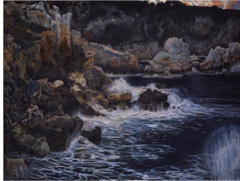
Joaquim Mir Cala encantada (1902) Oli sobre tela, 157 x 205 cm Museu de Montserrat, 200.466

Albert Espona, mort prematurament als 58 anys el desembre del 2023, va ser un artista i dissenyador gràfic que va utilitzar a favor de la seva gran creativitat, les noves tècniques digitals. La llum i el moviment són dues de les grans temàtiques que va explorar en les seves obres digitals, impreses en suports diversos, com grans caixes de llum. Aquest "riu" d'un blau intens, format per línies i ones, sobre un fons negre és representatiu de la seva recerca formal i tecnològica. Un exemple de l'ús de les noves tecnologies per crear imatges altament poètiques. Espona admetia que s'inspirava en la ciència i la naturalesa per a les seves obres i en conceptes com el món quàntic, les partícules subatòmiques, els camps de força i les ones. Per això aquesta gran caixa de llum no desentona gens al costat de la natura salvatge que representa Joaquim Mir.