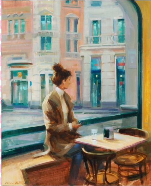
Mònica Castanys In the same café (2024) Oli sobre fusta Galeria Anquin's (Reus)