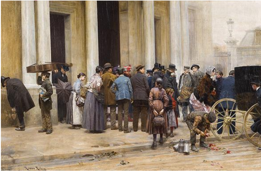
Romà Ribera Sortida del ball (c. 1888) Oli damunt tela Galeria Gothsland (Barcelona)