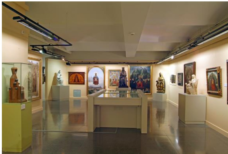
Sala Nigra Sum